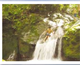
●ウォータースライダー