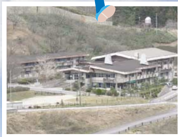
●鳥取県立船上山少年自然の家